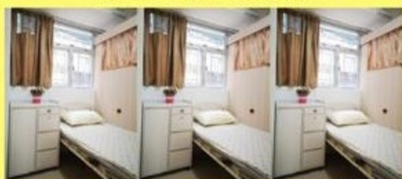
單人房 雙人房 三人房