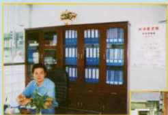
▲ 接待處 護理中心▶

老吾老以及人之老，本院貫徹以客為本的精神，以愛心與關懷為有需要之長者提供溫暖如家之起居照顧及專業持續護理，使長者生活多姿多彩，備受尊重環境中安享晚年。