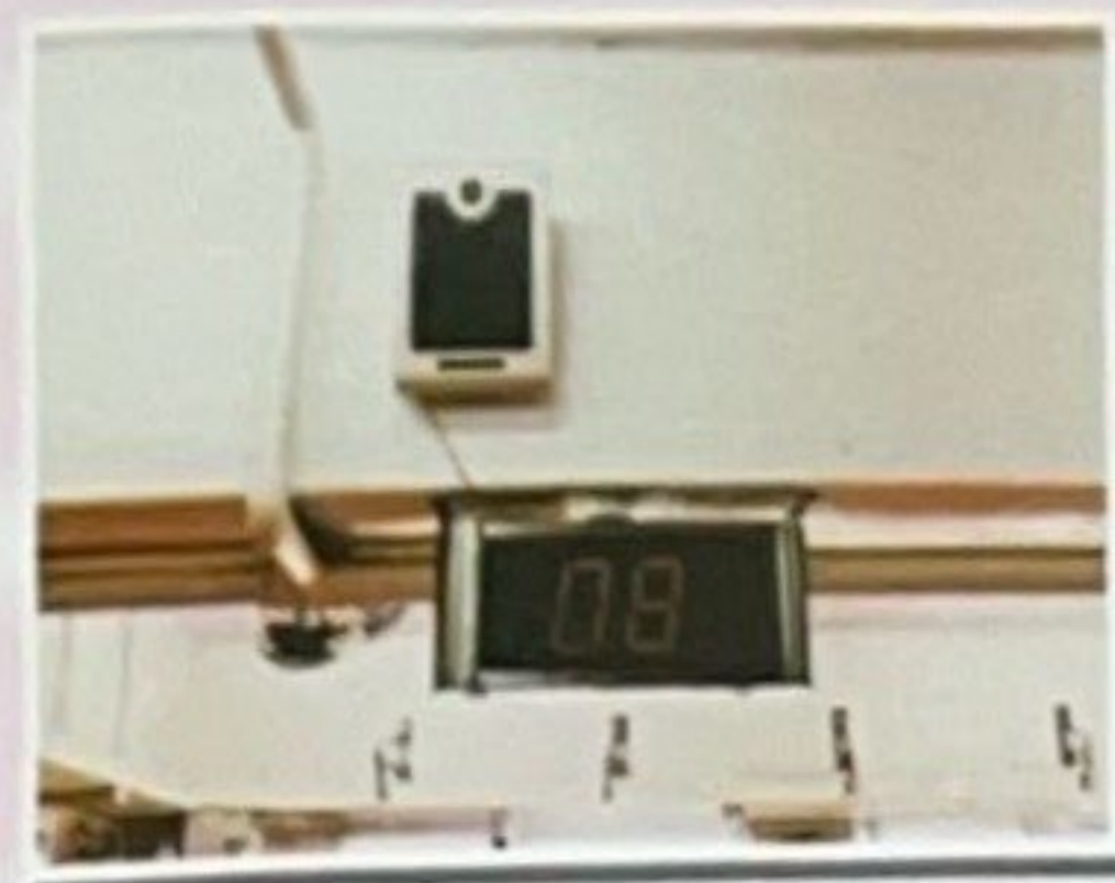
▲ 大廳 ▶

院內環境清潔，光線充足，設備齊全，包括：懷舊中式廳、物理治療區、醫護辦公室、會議室、廚房、洗碗房、洗衣房、飯廳等…。設備和器材因應俱全，包括：預防游走警報系統、閉路電視、全院召喚鐘系統、運動拉繩及腳踏車、氧氣機、吸痰機、血含氧量測試機、血糖機、攪床、氣墊床、高背椅、輪椅及物理治療器具等…。