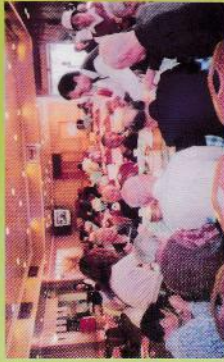
▲ 外出茶聚品嚐美食