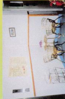
▲ 寧靜小廳書報閱讀