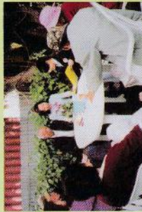
▲ 聯系本院與長者家人溝通